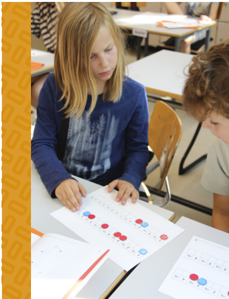
RYTMEGITTER; DER FORHANDLES LØSNINGER