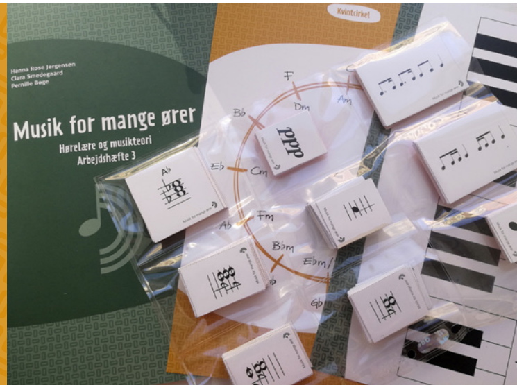
HVER ELEV HAR SINE KORT I EN PLASTLomme